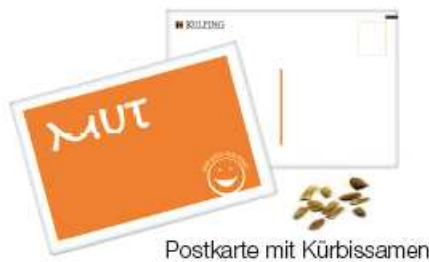
Postkarte mit Kürbissamen